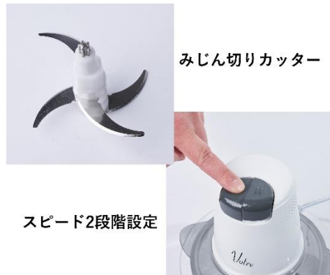
みじん切りカッター

「刻む」・「混ぜる」・「おろす」3way 仕様。4枚刃のみじん切りカッターを使用しており、食材をスピーディーにカットします。また、回転スピードは2段階で選択できるので、玉ねぎなどの柔らかい食材はL0(低速運転)を使用するなど、食材に合わせて使用できます。