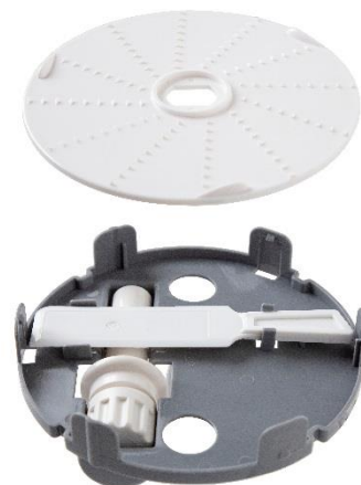
MFC-G501(W)ふた裏収納ホルダー