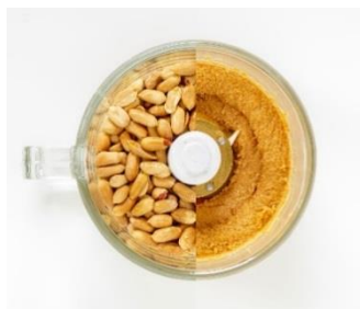
MFC-G501(W)調理例(ピーナッツペースト)

「刻む」・「混ぜる」・「おろす」に加え、「練る」も可能な4way仕様。ふたの裏側に収納ホルダーがあり、おろしプレートやヘラ、プレート軸を収納できます。