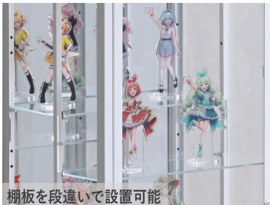
棚板を段違いで設置可能