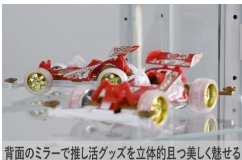
背面のミラーで推し活グッズを立体的かつ美しく魅せる

商品本体の背面にミラーを採用し、推し活グッズの後ろ姿を立体的かつ美しく魅せるディスプレイが可能です。さらに、テープライトの電源コードを通すための穴を採用 ※3 。テープライトをケースの内側に取り付けることで、コレクションの陰影やディテールを美しく引き立たせた、こだわりの演出が可能です。ライトの色味等を調整することで雰囲気もガラッと変わり、この「コレクションケース」1台で、オリジナリティ溢れる魅せ方を叶えます。