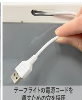
テープライトの電源コードを通すための穴を採用