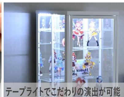
テープライトでこだわりの演出が可能