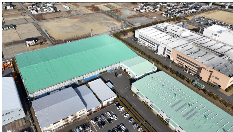
トーヨーコーケン株式会社 山梨事業所

「ともに、未来を切拓く」をパーパスに掲げる株式会社山善(本社:大阪市西区/代表取締役社長:岸田貢司 以下、当社)と、大阪ガス株式会社100%子会社のDaigas エナジー株式会社(本社:大阪市中央区/代表取締役社長:井上雅之 以下、Daigas エナジー)は、2024年4月からトーヨーコーケン株式会社(本社:東京都江東区/代表取締役社長:渡邊一人 以下、トーヨーコーケン)の山梨事業所にて、コーポレートPPA※1を開始いたします。これは、当社とDaigas エナジーがトーヨーコーケン 山梨事業所に、太陽光発電設備を設置・保有・維持管理をしながら、そこで発電された太陽光由来の再生可能エネルギー100%の電気(以下、再エネ電気)を約20年間にわたりトーヨーコーケンに供給・販売するものです。