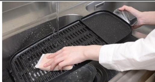
プレート裏面のフッ素コート

そこで、プレートの表面だけでなく、ヒーターを取り付けている裏面にもフッ素コートを実施しました。従来品よりも水洗いで汚れを落としやすく、お手入れが簡単です。