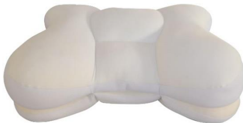
未来のeスポーツ プロゲーマーたちと共同開発した枕