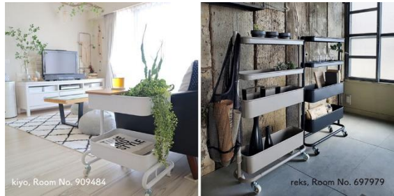
※写真は掲出予定の仮のものですが

「RoomClip」に投稿された「バスケットトローリーシリーズ」の使用シーン写真は、累計 6,000 枚を超え、ステキな使い方を再現やパネルでご紹介するコーナーです。様々な『実例』を参考に、ご自宅での使用シーンをイメージしていただけます。