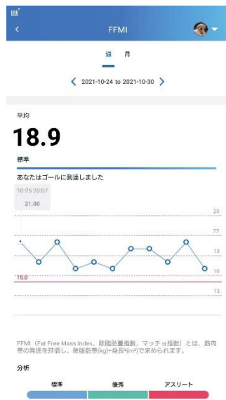
各測定値の推移グラフや分析結果