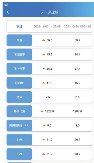
日にちを指定して 2 時点比較も可能