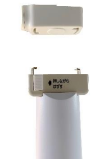
「引掛シーリングタイプ」