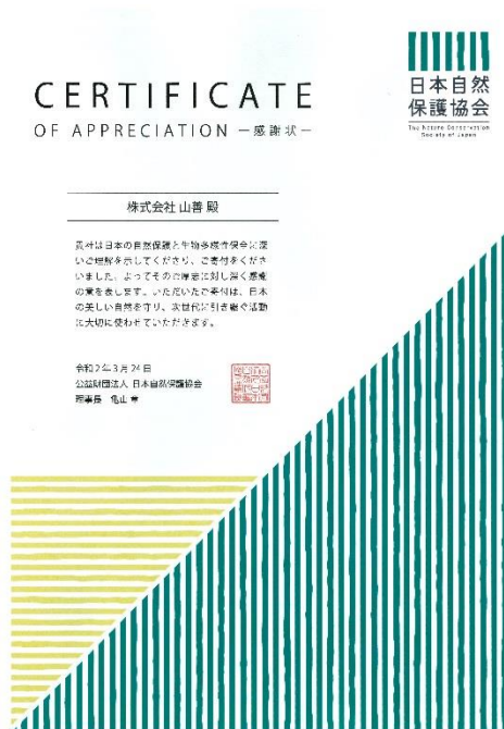
日本自然保護協会から 贈呈された感謝状

当社はグリーンボールプロジェクトを通じて日本自然保護協会の活動を支援しています。同協会は日本国内の世界自然遺産の保護活動をはじめ、日本の豊かな自然を守る取り組みや、海の環境保護活動を行っています。当社は環境優良商品の普及拡大と共に、同協会が取り組むビーチクリーンやマイクロプラスチック調査等の環境保護活動を支援することで、持続的且つ多面的に、脱炭素型社会の実現を目指して、積極的に活動してまいります。