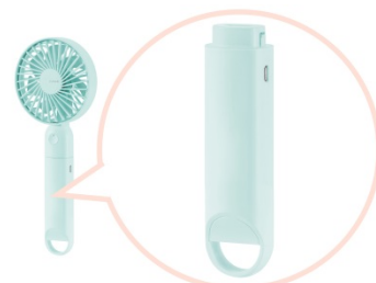
モバイルバッテリーとしても使用可能

本体のバッテリー部分は取り外して、モバイルバッテリーとして使用することも出来るので、外出先でスマートフォン等の充電も可能です。