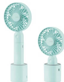
高さは2段階に調整可能

デスクで USB につないで、付属の給電スタンドに立てて使うことも、外出先で使うことも出来るハンディファン。付属のストラップで首からぶら下げることも出来るので、レジャーやアウトドアシーンでも大活躍です。