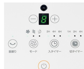
スタイリッシュなタッチスイッチ

操作部は軽く触れただけで反応するタッチスイッチを採用。表面がフラットになっているのでお手入れも簡単。デザイン性にも優れているので、リビングやダイニングなど目につく場所で使ってもインテリアの邪魔をせず、空間にもすっきりと馴染んでくれます。