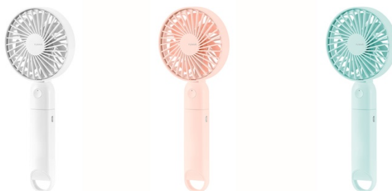
ライトホワイト(LW) ライトピンク(LP) ライトブルー(LA)

“使っているだけで気分がパッと明るくなる”をコンセプトにした FUWARI シリーズ。外出先で思わず人に見せたくなるデザインが特徴です。カラーはライトホワイト(LW)、ライトピンク(LP)、ライトブルー(LA)の3色展開。気分やお好みに合わせてお使いいただけます。