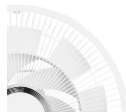
16枚羽根ツインブレード

2017年から7枚羽根ツインブレードを採用した扇風機を発売し好評をいただいていたのですが、今年は16枚羽根ツインブレードを追加し、より柔らかくでより自然に近い風を再現しています。お年寄りや小さなお子さんがいる家庭にも最適です。